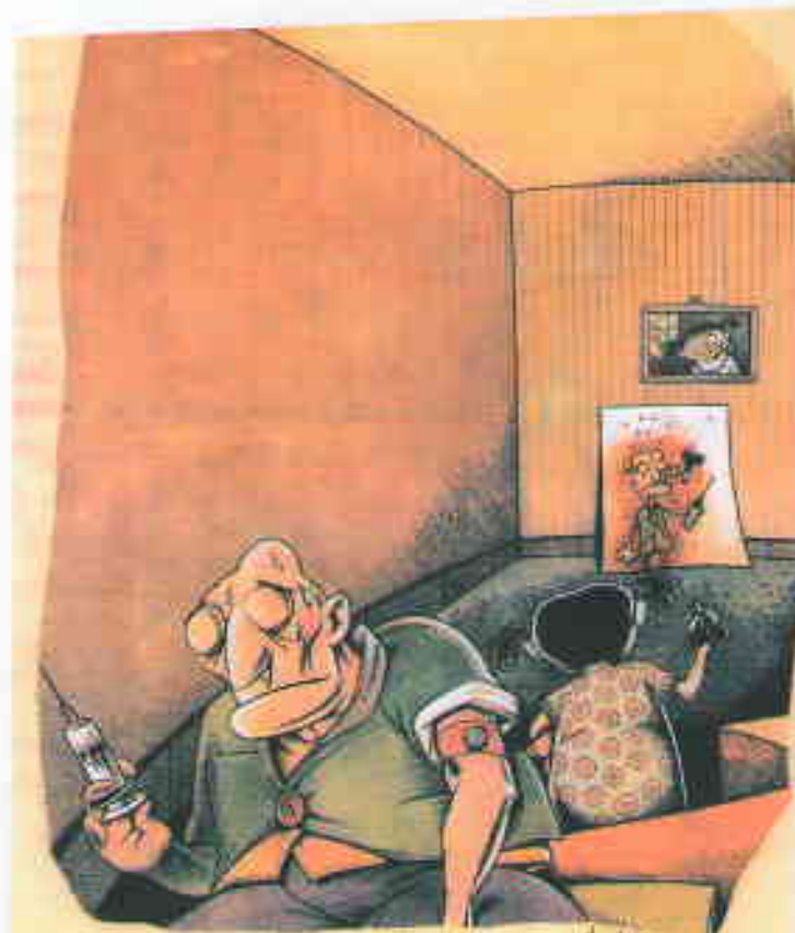
حاجار حنفی ایران JAMAL RAHMATI/IRAN